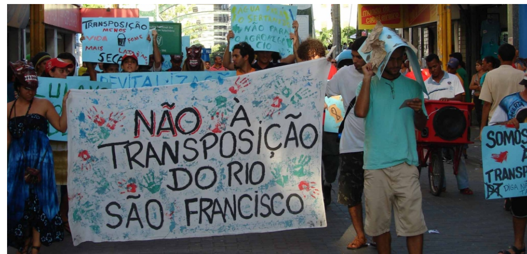
Manifestação no centro do Recife contra a transposição do Rio São Francisco - 22 de março

Recentemente ao apresentar, em Brasília, as linhas gerais do PDE (Plano de Desenvolvimento da Educação), o presidente Luiz Inácio Lula da Silva afirmou que a educação no Brasil é uma das “piores do mundo”. Lula tem o desplante de fazer tal declaração como se não fosse justamente ele o principal responsável pela situação calamitosa da educação brasileira. Um mês antes desta afirmação hipócrita, o mesmo Lula anunciou um corte de 609,4 milhões no orçamento da educação para o ano de 2007. Enquanto isto não falta dinheiro para os banqueiros e agiotas internacionais, em 2007 o governo do oportunismo e da demagogia vai destinar 59% do orçamento federal para o pagamento de juros da dívida pública